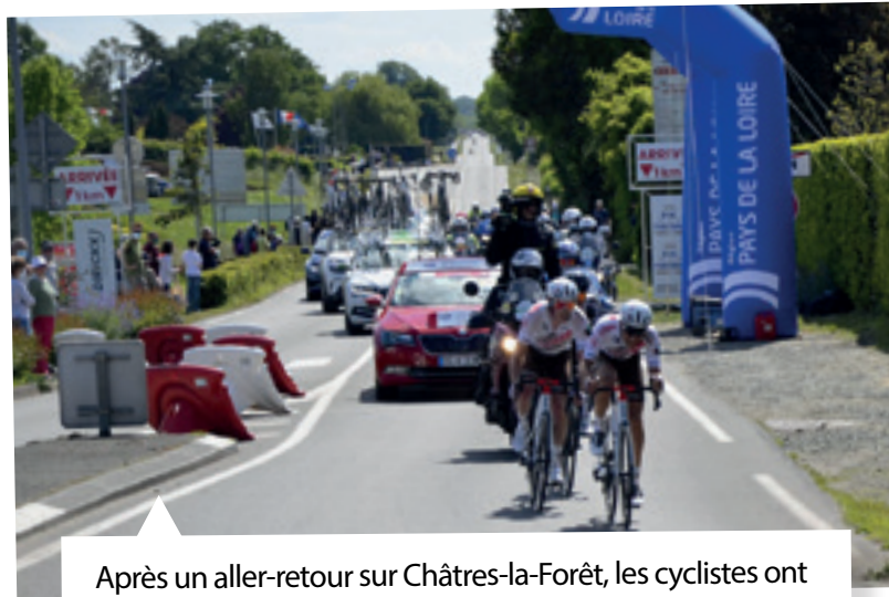
Après un aller-retour sur Châtres-la-Forêt, les cyclistes ont pris la direction d'Evron pour l'arrivée.