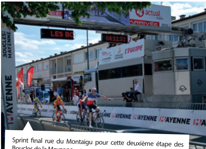
Sprint final rue du Montaigu pour cette deuxième étape des Boucles de la Mayenne.