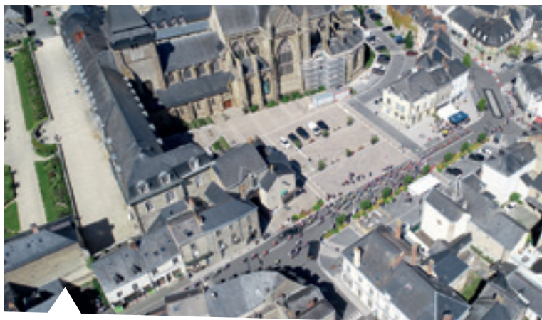
Passage des 126 coureurs dans le centre-ville d'Evron, devant la Basilique.